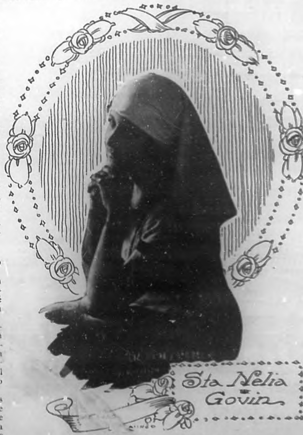
Distinguida dama de delicada belleza y cautivadora distinción.