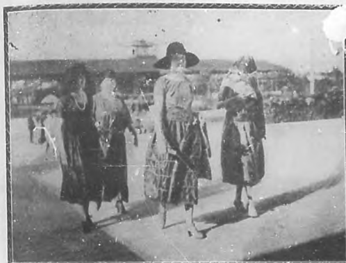
Una de las más distinguidas familias habaneras, al llegar al Hipódromo.

Reputado arquitecto, autor del proyecto de construcción del Temple de los Estudiantes.