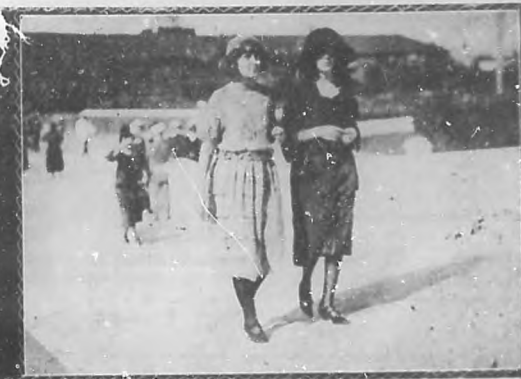
Dos conocidas señoritas que asistieron a las carreras el primer día de temporada.