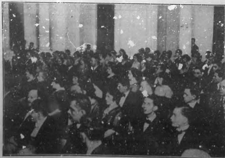
Un aspecto de la nutrida y selecta concurrencia que asistió a la sesión solemne celebrada recientemente por la Academia de Artes y Letras.