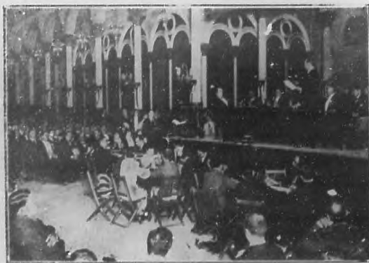
Un aspecto de la sesión inaugural del Congreso de Corporaciones Econó- micas, que se está efectuando en el Centro de Dependientes.

prestre ofrecidos por la Secretaría de Sanidad Viernes 16. —Velada y función teatral en uno de los principales coliseos. Sábado 17.