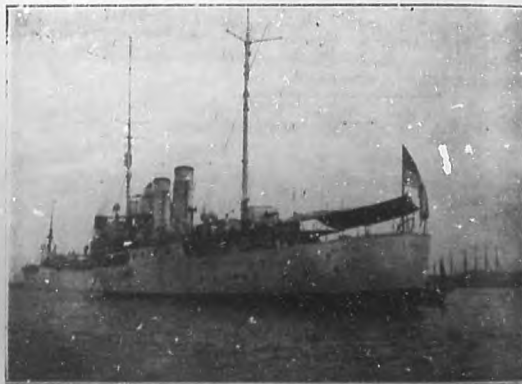
El crucero de la armada inglesa "Valerian", que se encuentra fondeada en puerto, hace varios días.

—Sesión solemne y clausura del Quinto Con- greso Médico.