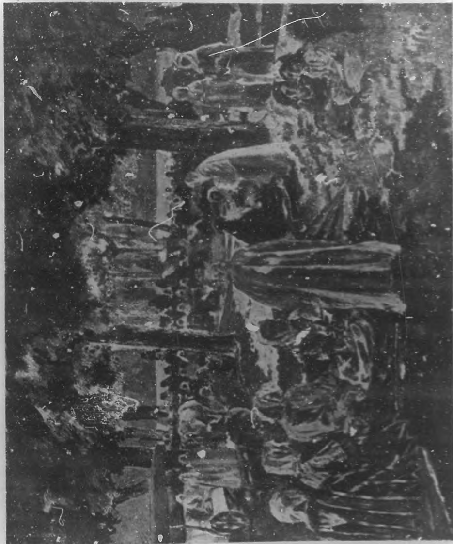
(Gravado tricolor de BOHEMIA.)