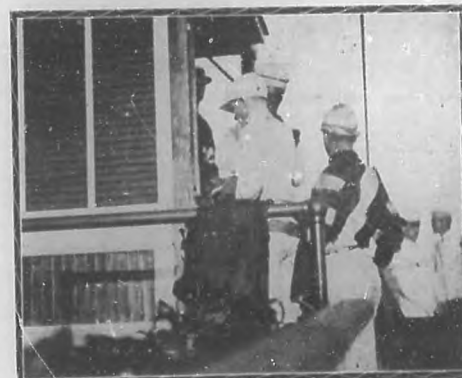
Dos de los jockeys ganadores el día de la inauguración.