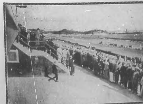
La pista de "Oriental Park" durante una de las carreras más reñidas, el día de la inauguración de la temporada.