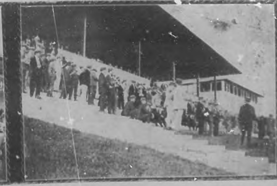
Vista del Gran Stand de "Oriental Park", el día del "meeting" inaugural de la presente temporada.