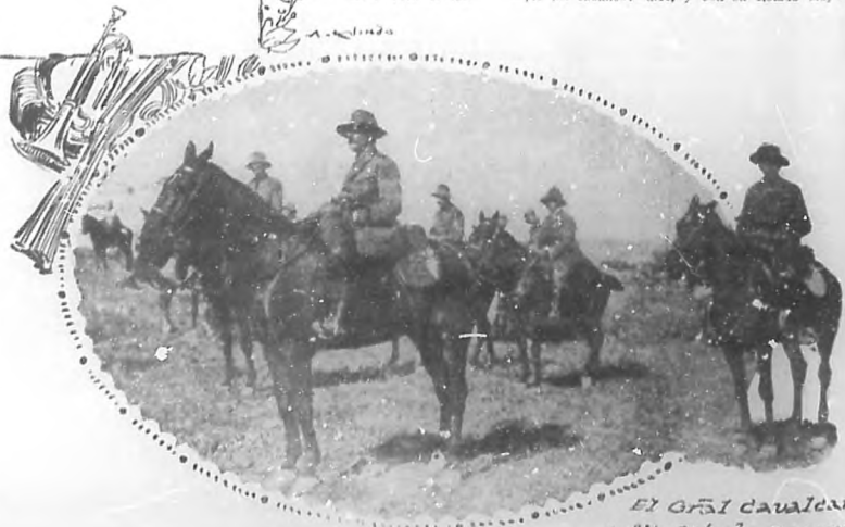
El Gral Cavalcante y su Estado Mayor.