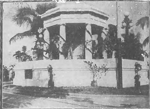
El Temple de los Estudiantes, momentos antes de la llegada de la peregrinación, que con tan brillante éxito se efectuó el pasado domingo.

El pasado 27 de noviembre y con toda solemnidad, tuvieron efecto los solemnes actos con que se hubieron de conmemorar los luctuosos sucesos aquellos ocurridos años ha, y en los que perecieron la vida ocho niños inocentes, estudiantes de Medicina.