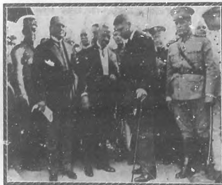
El Hon. Presidente de la República y su comitiva, retirándose del Temple, después de haber depositado su ofrenda floral.

Y una bella combinación de flores blancas sobre fondo de verde follaje, con un artístico letrero en cintas de seda, de la Escuela Normal de "Jardines de la Infancia".