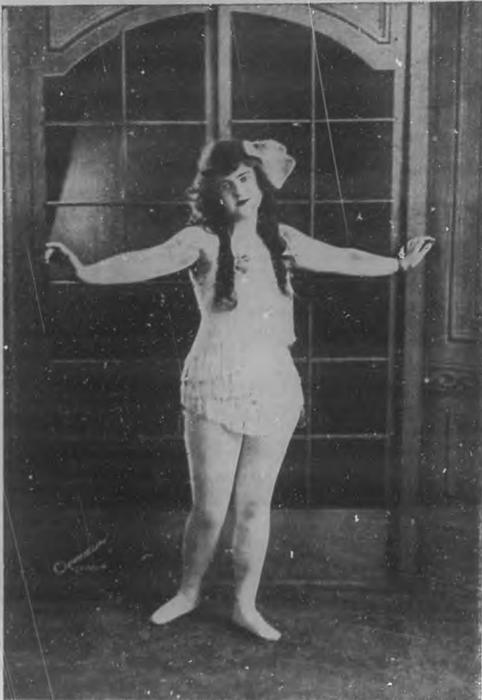
THE DAINTHY GIRL (La Muchacha aérea).—Notable número que actúa en el "Nacional" con el circo "Publilones", y que a diario es aplaudidísimo, por el numeroso público que llena la sala de dicho teatro.