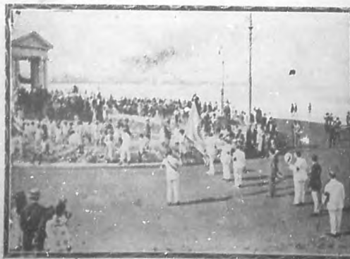
Los miembros del Club Rotario, que con la bandera de dicha institución al frente, asistieron a la Peregrinación, contribuyendo así a la mayor brillantez del acto.