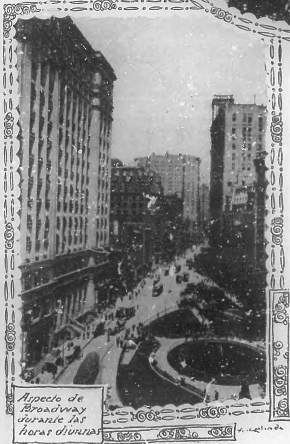
Aspecto de Broadway durante las horas diurnas