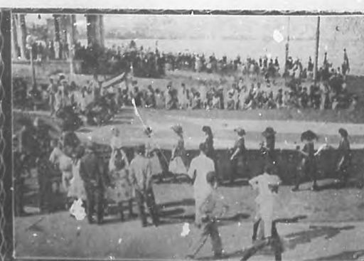
Las señoritas alumnas de la Universidad, llevando la hermosa bandera nacional que el Club Rotario regaló hace tiempo a los estudiantes universitarios.

de Artes y Letras, de aquellas décimas del nunca bien llorado José Joaquín Palma: